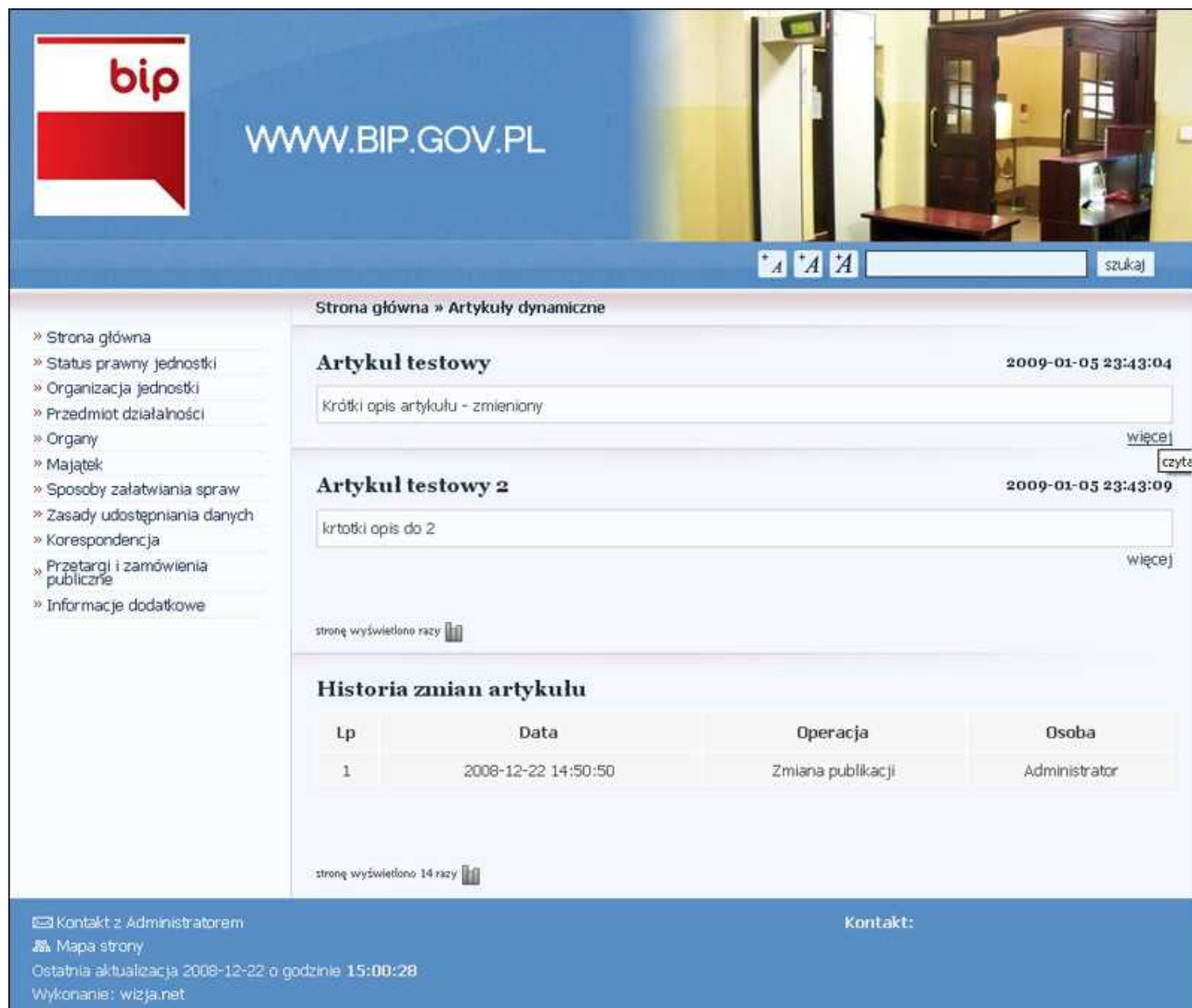
rys.2 lista artykułów dynamicznych

Artykuły są główną treścią prezentowaną w serwisie BIP. Przykładem takiego artykułu jest np. strona główna serwisu BIP, status prawny jednostki. Dodatkowo w systemie zostały zaimplementowane artykuły dynamiczne (są to treści pojawiające się w systemie w formie listy artykułów)