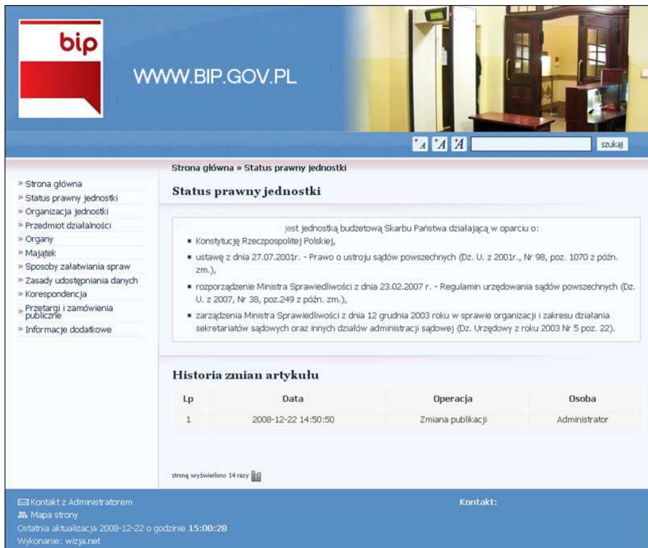
rys.1 widok artykułu

Po uruchomieniu system BIP wita nas stroną jak na poniższym obrazku: